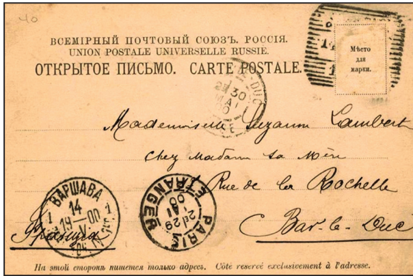
Рис. 6. Адресний бік другої поштівки серії