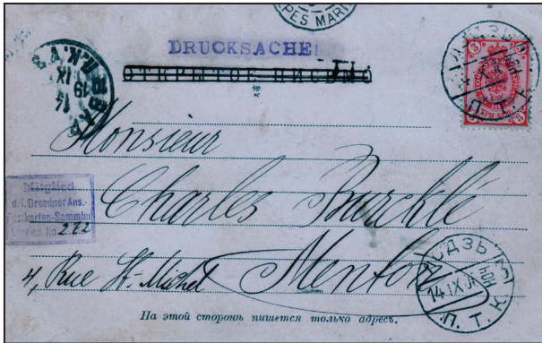
Рис. 2. Лицьовий (адресний) бік поштівки Л. Варгафтінга (1894–1897)

чатку члена дрезденського клубу колекціонерів листівок Фарайнса (Vareins) із порядковим номером «272», за яким вона, імовірно, зберігалась у його колекції (рис. 2).