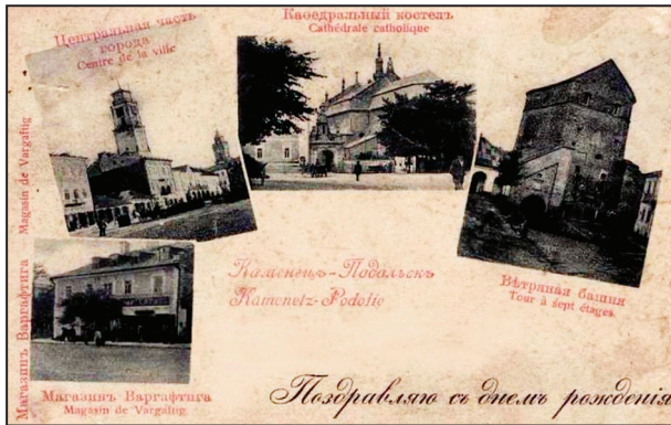
Рис. 7. Каме́нець-Подольськ (Kamenetz-Podolie). Магазинъ Варгафтига (Magasin de Vargaftig), Центральная часть города (Centre de la ville), Кафедральный костель (Cathédrale), Ветряная башня (Tour à sept étages). Б.м.: Магазинъ Варгафтига (Magasin de Vargaftig), [1899]