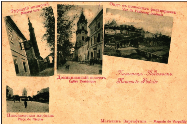
Рис. 8. Каменець-Подольськь (Kamenetz-Podolie). Турецький мінаретъ (Minaret ture), Доминиканський костелъ (Église Dominique), Видъ съ польскихъ фільварковъ (Vue du Faubourg polonais), Николаевская площадь (Place de Nicolas). Б.м : Магазинъ Варгафтига (Magasin de Vargaftig), [1899]

russe) 14 ; п'ята: Турецький мінарет, Домініканський костел, Вид з польських фільварок, Миколаївська площа (рис. 8) 15 ; шоста: Вид нового плану, Окружний суд, Троїцький монастир, Олександро-Невська церква (рис. 9) 16 .