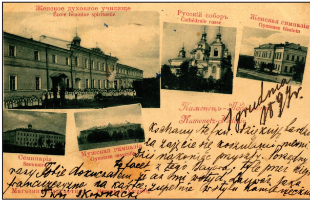
Рис. 4. Каменець-Подольськь (Kamenetz-Podolie). Женское духовное училище (École feminine spirituelle), Русскій соборъ (Cathédrale russe), Женская гимназія (Gymnase féminin), Семинарія (Seminaire), Мужская гимназія (Gymnase masculin). Б.м.: Магазинъ Варгафтига (Magasin de Vargaftig), [1899]

Друга поштівка з цієї серії відображала місто з південного та північно-боків (рис. 5). Відповідно до маркування та маршрута вона була відправлена з Варшави (14.V.1900) через Париж (2 el 29. AI. 00) у французький муніципалітет Бар-ле-Дюк (2 el 30. AI. 00) (рис. 6) 11 .