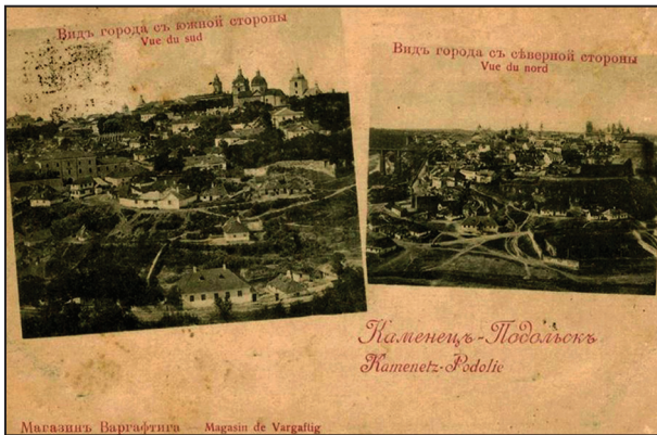
Рис. 5. Каменець-Подольськь (Kamenetz-Podolie). Видъ города съ южной стороны (Vue du sud), Видъ города съ северной стороны (Vue du nord). Б.м.: Магазинъ Варгафтига (Magasin de Vargaftig), [1899]

Друга поштівка з цієї серії відображала місто з південного та північно-боків (рис. 5). Відповідно до маркування та маршрута вона була відправлена з Варшави (14.V.1900) через Париж (2 el 29. AI. 00) у французький муніципалітет Бар-ле-Дюк (2 el 30. AI. 00) (рис. 6) 11 .