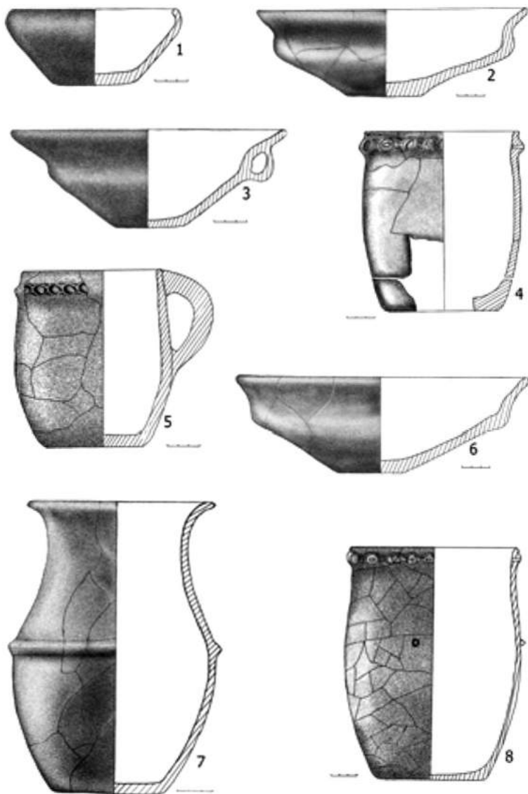
Рис. 2. Глиняний посуд із кургану № 1

зовні – одна половина коричнева, інша – чорна. Тісто із вкрапленнями дрібного піску, жорстви, шамоту, стінки підлощені. До верхньої частини тулуба і вінця прикріплена ручка, стрічкоподібна у перерізі. Діаметр вінець – 26,4 см, дна – 8,1 см, висота – 8,4 см.